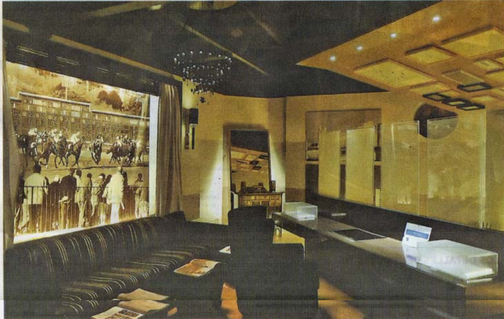
Automatización. Todo el loft está pensado desde la domótica: las cortinas, la dimerización de las luces; las pantallas y la música.