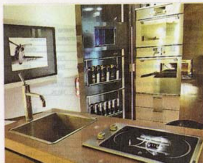
Ordenado. Las funciones culinarias quedan ocultas.