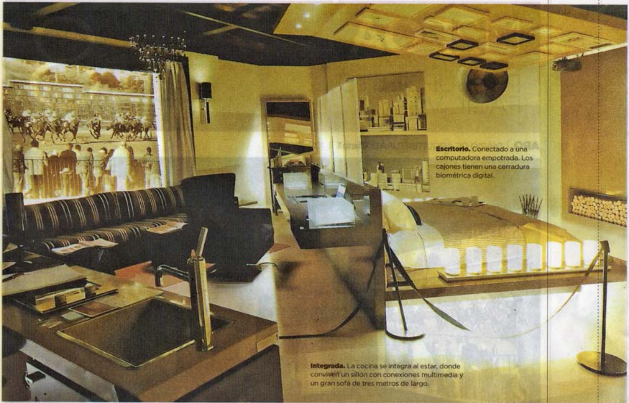
Escritorio. Conectado a una computadora empotrada. Los cajones tienen una cerradura biométrica digital.