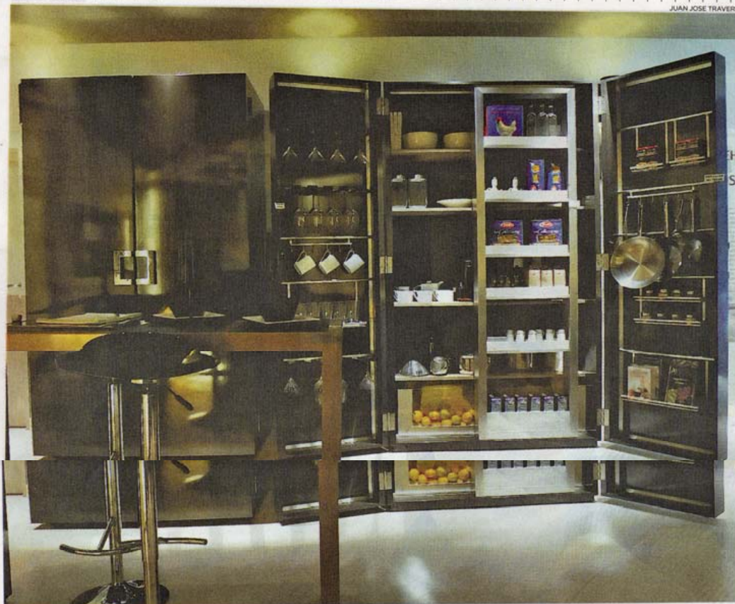
Cocina. El espacio de guardado se resolvió con módulos minimalistas laqueados en negro.